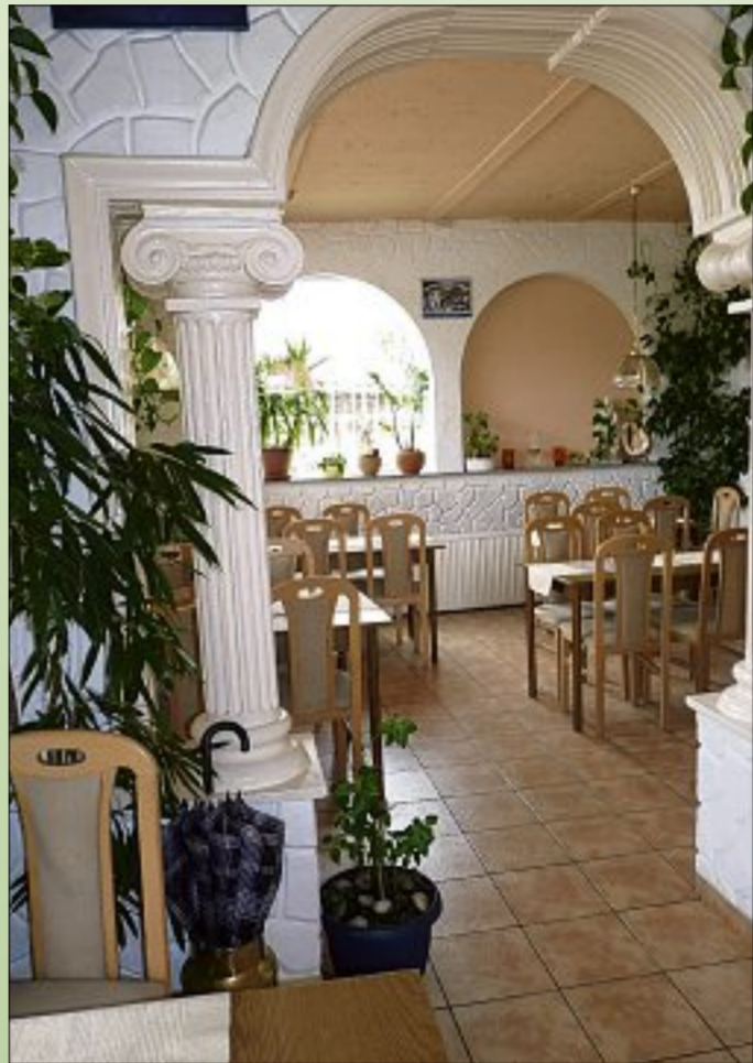
Auch ein gemütlicher Gastraum ist vorhanden.

Genuss auf griechische Art ist natürlich auch jenseits des Sommerfestes nahezu jederzeit möglich. Das gilt einerseits für Schlemmerfreunde, die sich die Speisen gleich vor Ort schmecken lassen wollen. Ihnen steht neben einem rundum ansprechenden, liebevoll ge-stalteten Innenbereich ein Biergarten direkt vor dem Res-taurant zur Verfügung. Der wurde zur Open-Air-Saison nochmals um 20 Plätze erwei-tert, sodass jetzt bis zu 40 Gäs-te sich die Spezialitäten vor dem Gebäude an der Ring-s-träÙe 64 schmecken lassen kö-nnen. „Gerne richten wir auch