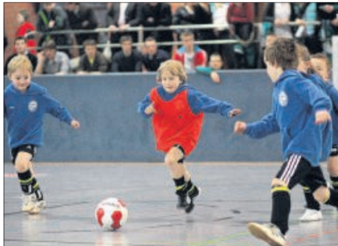
Die große Kulisse ließ die Fußball-Minis der Spielvereinigung Kuttenhausen-Todtenhausen völlig kalt.