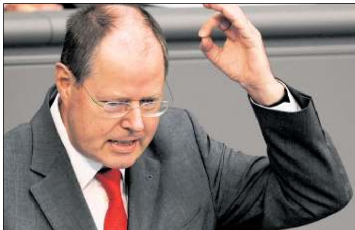
Finanzminister Peer Steinbrück sah bei der Debatte im Bundestag keine neuen Risiken für die Steuerzahler.